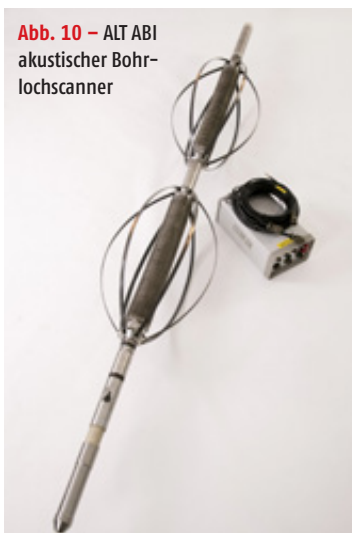
Abb. 10 – ALT ABI akustischer Bohrlochscanner

Ultraschallscanner (Sonic): Die Sichtbarmachung der Rohrwand bei undurchsichtigen Verhältnissen kann durch Ultraschallscanner erfolgen (Abb. 10). Diese Technik wird schon sehr lange in der Bohrlochgeophysik angewendet. Die Rohrwand wird durch Ultraschall-Laufzeitmessung abgetastet. Je nach Messsystem