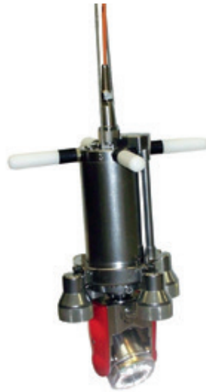
Abb. 8 – IPEK Rovion RXC Schwenkkopf Zoom-Brunnenkamera mit parallelem Laser