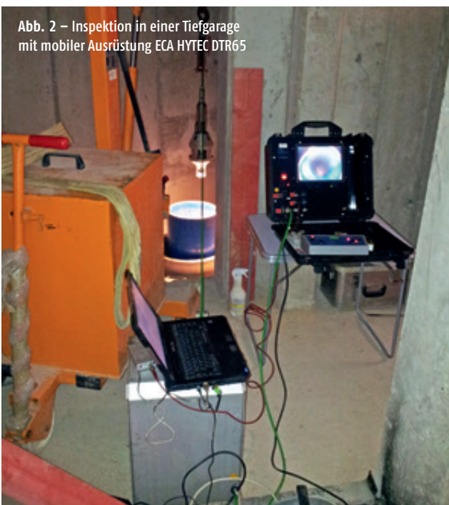
Abb. 2 – Inspektion in einer Tiefgarage mit mobiler Ausrüstung ECA HYTEC DTR65

Bei großen Tiefen ab 1.000 m, abhängig von der geothermischen Tiefenstufe, ist eine temperaturresistente Elektronik und Aufnahmeeinheit erforderlich. Dies spielt bei den vermehrt in Betrieben stehenden Geothermiebrunnen eine immer größere Rolle. Normale CCD-Kameras sind von 0 bis etwa 60 °C, maximal 65 °C, einsatzstabil. Für höhere Temperaturen muss die Kameraelektronik thermoelektrisch mit Peltier-Elementen gekühlt werden, die Abwärme in Kupferblöcken innerhalb des Gehäuses gespeichert und das druckdichte Kameragehäuse als Vakuum-isoliertes Dewargefäß ausgebildet sein.