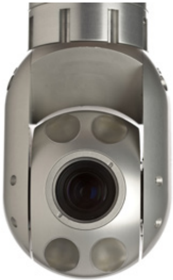
Abb. 7 – INUKTUN-Schwenkkopfkamera SP120HD