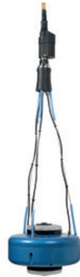
Abb. 9 – IBAK Panorama SI optischer Scanner mit doppeltem Fischauge

220° schwenkbar und endlos drehbar. Da die Optik von einer planen Scheibe abgedeckt ist, sind keine Bildverzerrungen möglich. Hier können auch parallele Laser optimal verbaut werden.